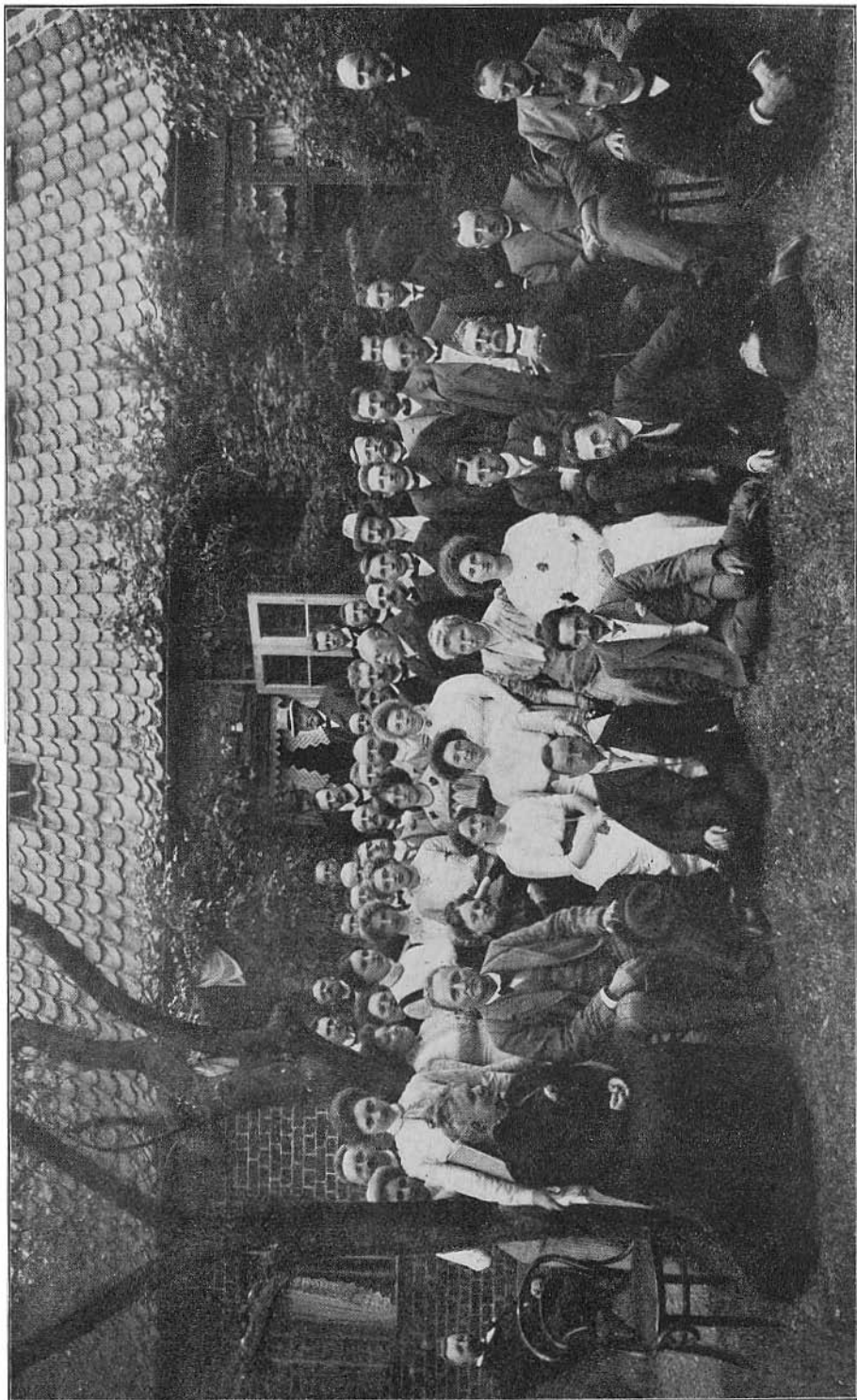
Fra Kampen i Lemvig, Pinsen 1911